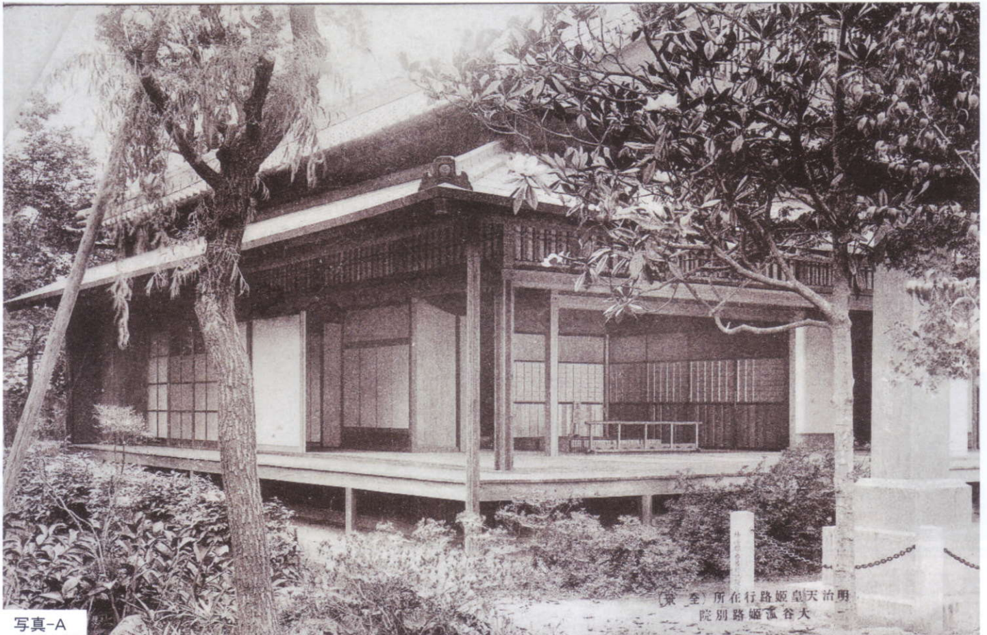
〔京 全〕所在行路姫皇天治明 院別路姫大谷